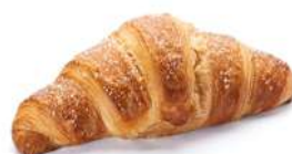
CROISSANT LINEA HOTEL margarina - 55 g