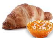
MINI ECCELSA ALBICOCCA glassato con zucchero di canna, melange al burro - 45 g