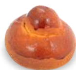
BRIOCHESE COL TUPPO 100 g