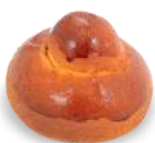
BRIOCHESE COL TUPPO 85 g