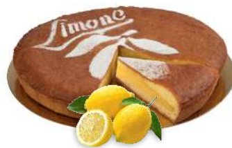
TORTA AL LIMONE 12 fette - 1200 g pasta frolla e crema di limone