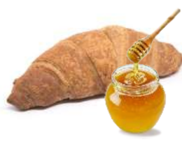
INTEGRALE AL MIELE farcitura al miele 40% - 85 g