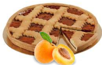
CROSTATA ALL'ALBICOCCA 12 fette - 1000 g pasta frolla e farcitura d'albicocca

PRONTE DA SCONGELARE, PRETEGLIATE A FETTE