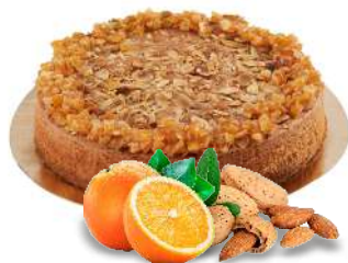
TORTA MANDORLA E ARANCIA 12 fette - 1200 g crema di arance e composto di mandorla