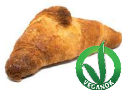
VEGANO CURVO 85 g