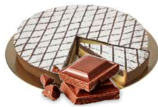
TORTA AL CIOCCOLATO 12 fette - 1200 g pasta frolla, crema pasticcera e cake al cioccolato