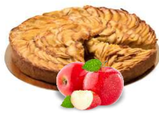
TORTA ALLE MELE 12 fette - 1300 g pan di spagna e passata di albicocche