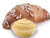
MINI ECCELSA CREMA glassato con scaglie di zucchero, melange al burro - 45 g