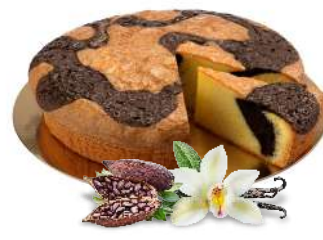
TORTA MORBIDA MARMORIZZATA 16 fette - 900 g vaniglia e cacao